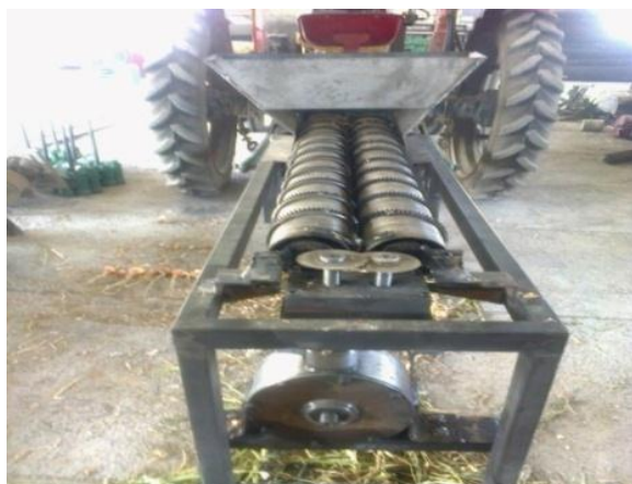
شکل ۵- نمایی از دستگاه سرزن غلتکی، در حالت اتصال به تراکتور