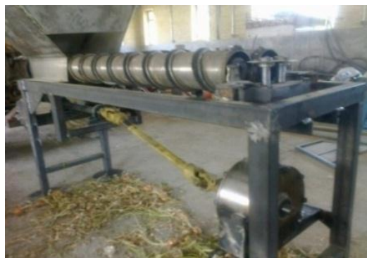
شکل ۳- نحوه اتصال میل گاردان به جعبه دنده مکانیزم برش