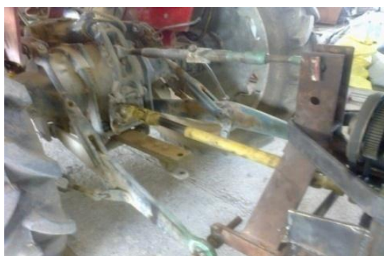
شکل ۴- نحوه اتصال دستگاه سرزن به تراکتور